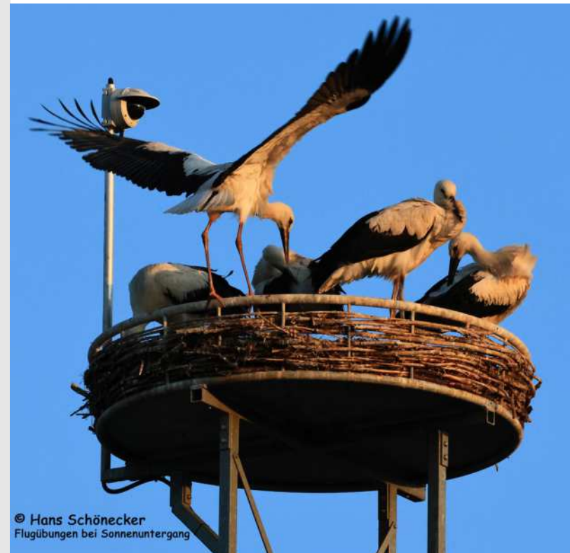
Flugübungen bei Sonnenuntergang

Hans Schönecker, Storchenauftraggeber des Landesbundes für Vogel- und Naturschutz